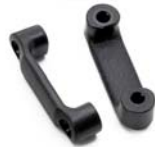
D-beslag Antal: 4